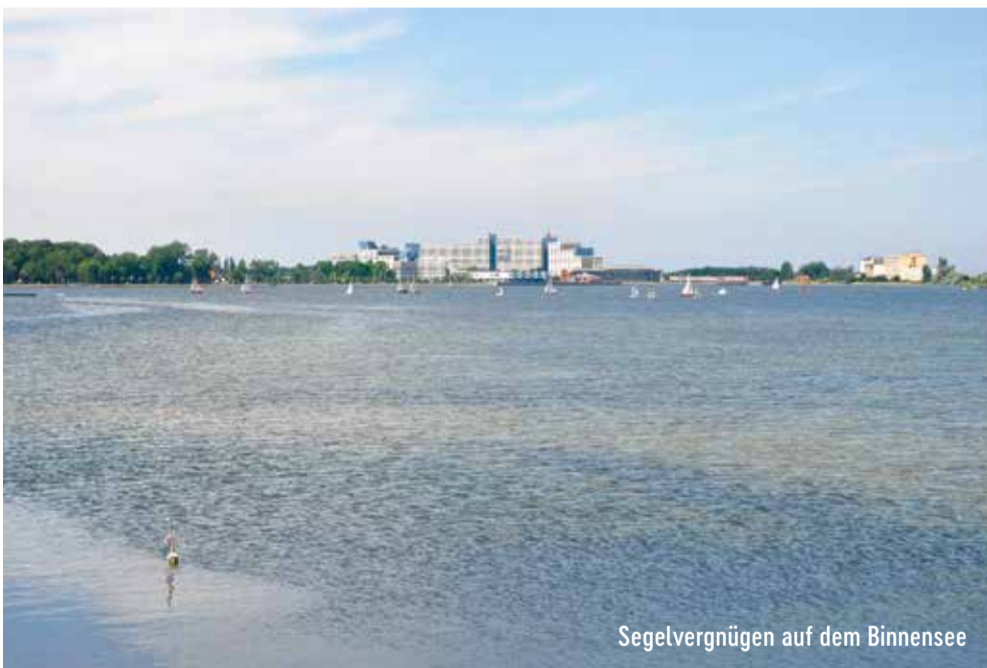
Segelvergnügen auf dem Binnensee