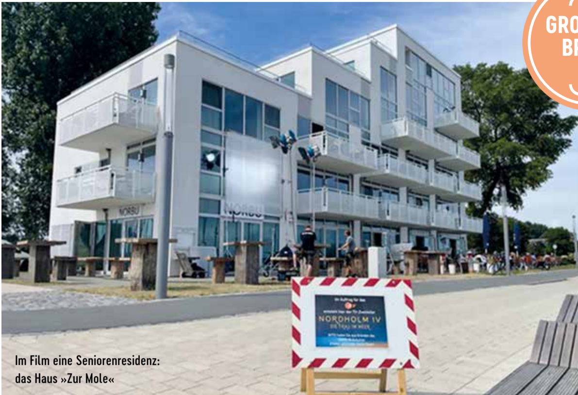
Im Film eine Seniorenresidenz: das Haus »Zur Mole«