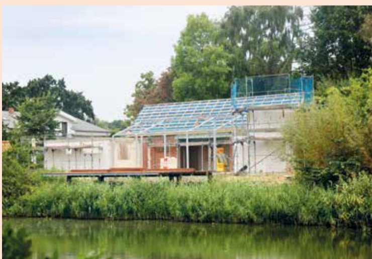
Umbau des ehemaligen Feuerwehrhauses am Dorfteich

Schon seit vielen Jahren ist Großenbrode aus dem Dornröschenschlaf erwacht, mehrere Projekte lassen die Gemeinde immer attraktiver werden. Neuester Schatz ist die Umgestaltung der Dorfmitte mit Alter Schmiede und Sprüttenhaus, also dem ehemaligen Feuerwehrhaus. Für rund 1,1 Millionen Euro soll aus dem Dorfplatz inklusive Teich ein neues Kulturzentrum werden, in dem man künftig sogar heiraten kann. Gedacht ist laut Gemeinde, das Spritzenhaus als neuen Mittelpunkt für Veranstaltungen zu nutzen und die Schmiede als Hochzeitsschmiede zu errichten. »Wir wollen die Geschichte des Ortes erlebbar machen und die Kultur in der Gemeinde manifestieren«, heißt es von den Architekten, die das Projekt jetzt umsetzen. Die neue Schmiede sei dabei der alten Konstruktion nachempfunden. Es werde ein Fachwerkbau mit Eichenbalken. Der Nachbau soll künftig auch für Trauungen genutzt werden. Bürgermeister Jens Reise kann diese aufgrund seiner Zulassung als Standesbeamter sogar selbst durchführen. Nebenan ist ein achteckiger Pavillon vorgesehen. Das neue Kulturzentrum soll neben Anbauten für Küche und sanitäre Anlagen auch einen Wintergarten und eine Terrasse erhalten, die, auf Pfähle gesetzt, in den Dorfteich hineinragt.