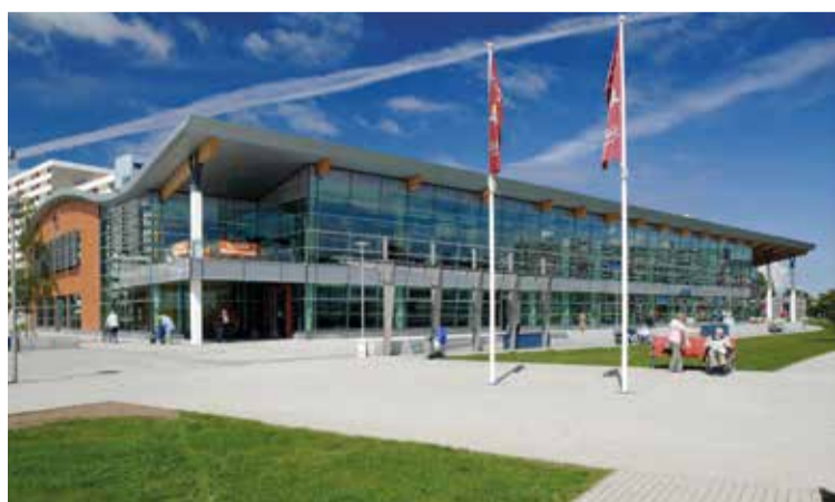
Mögliche Fläche für einen Schwimmbadneubau am »Aktiv-Hus«