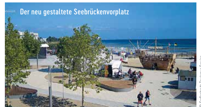
Der neu gestaltete Seebrückenvorplatz